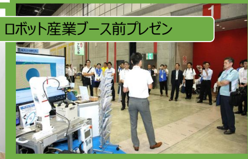
ロボット産業ブース前プレゼン