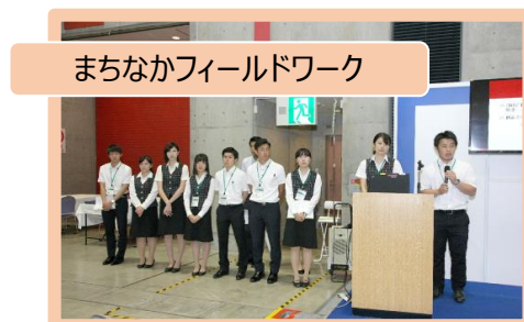
まちなかフィールドワーク