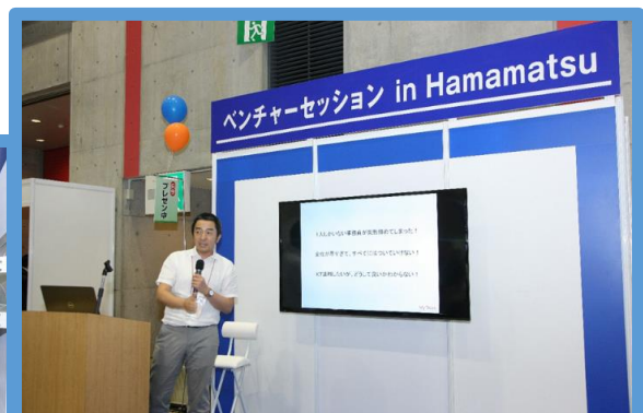
ベンチャーセッション in Hamamatsu